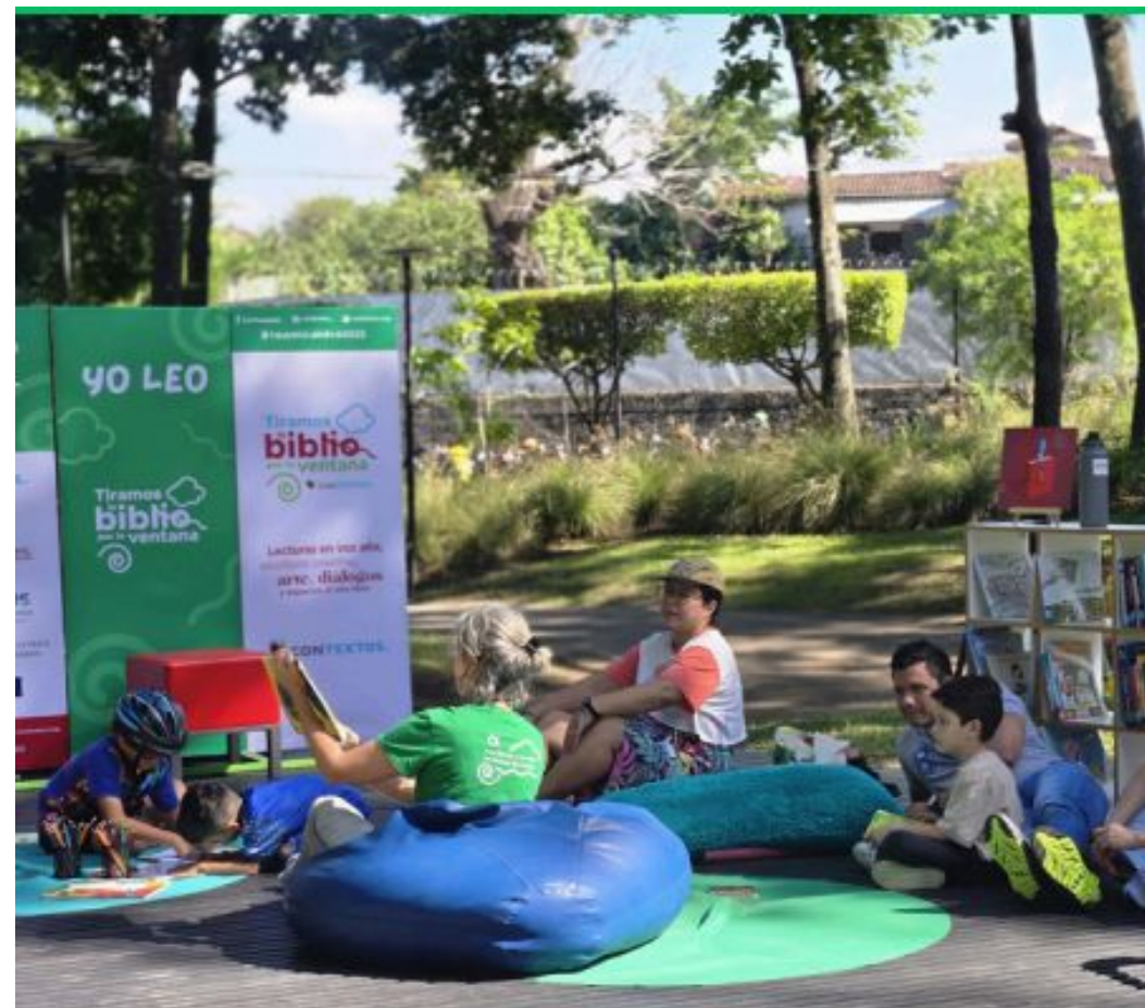
Evento: Tirando La Biblio por la Ventada, organizado por ConTextos