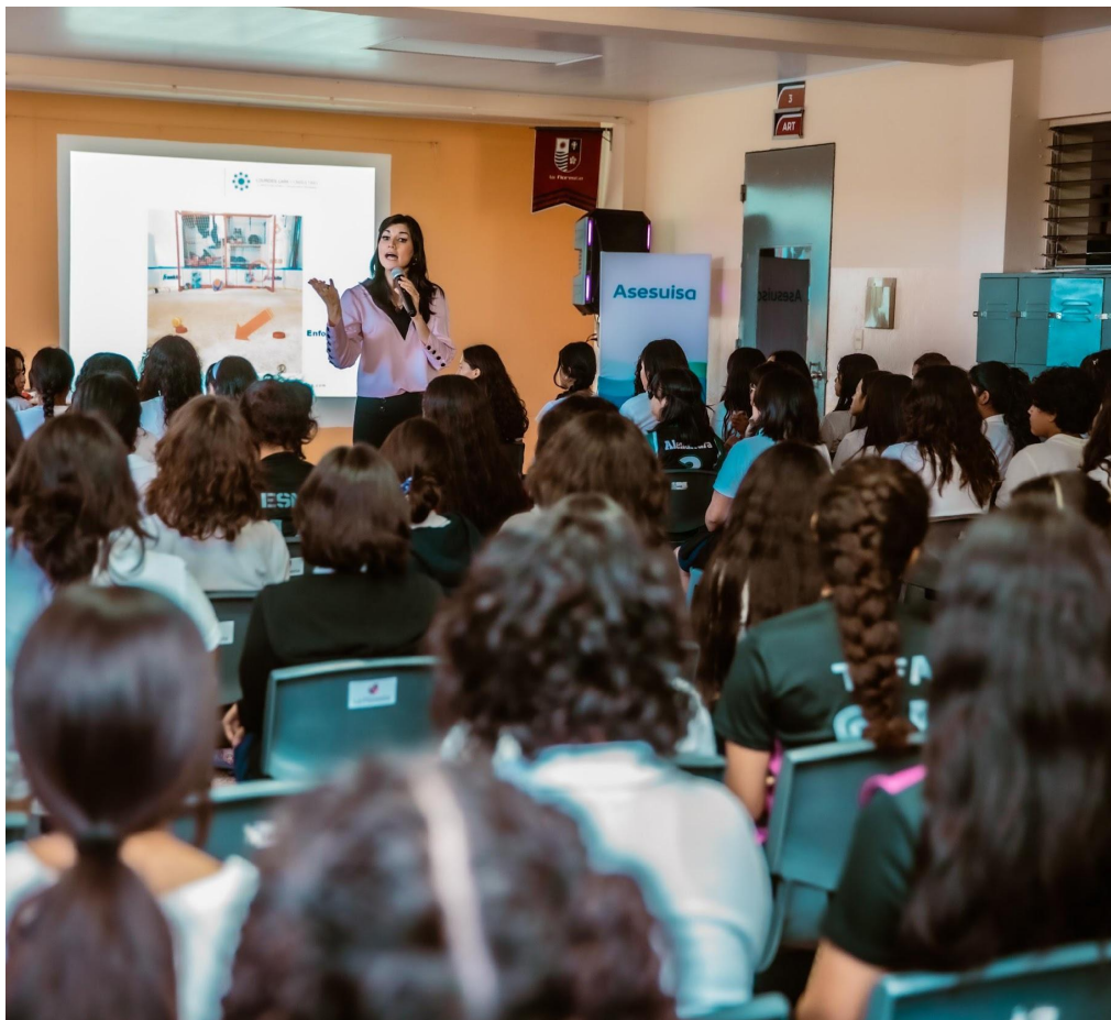
Becas a Colegio Citalá y Villanueva de la Asociación para la Promoción Humana (APROHU)