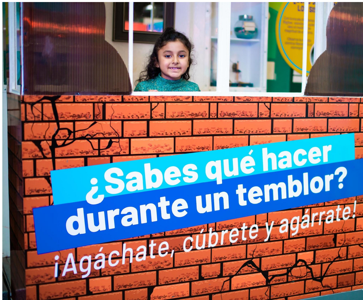
Exhibición Riesgolandia en Museo Tin Marín