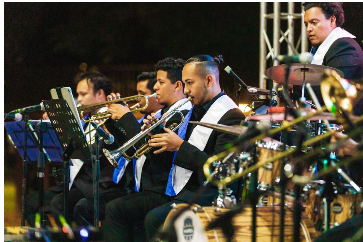
Concierto “Los Sonidos de la Navidad” Asesuisa