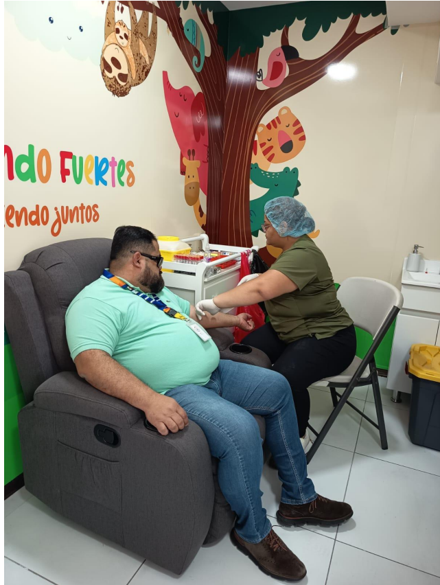
Jornada exámenes de laboratorio