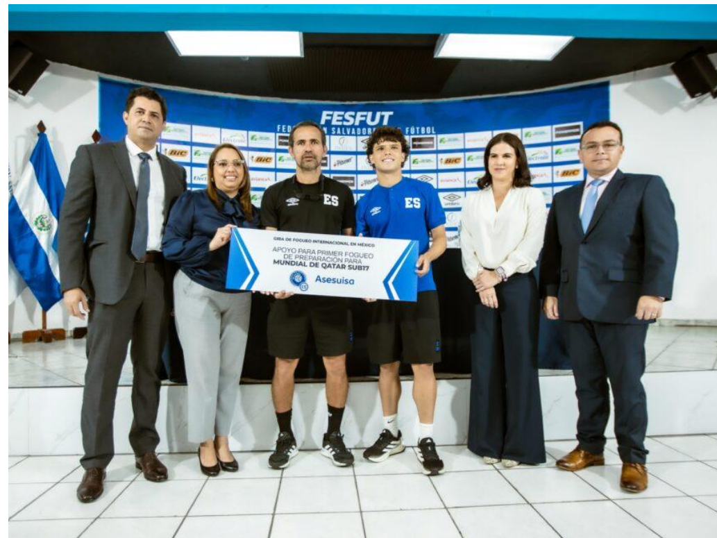
Apoyo a FESA