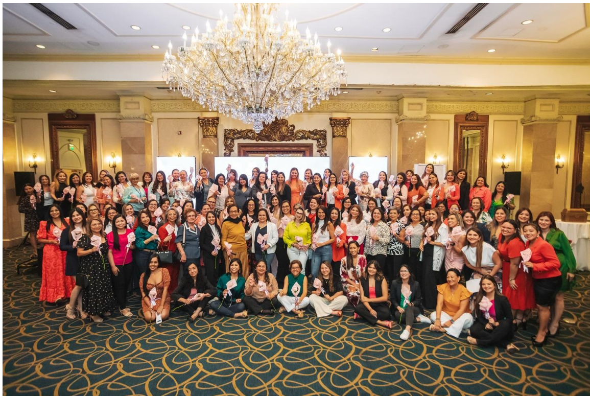
Conmemoramos el Día de la Mujer con asesoras de seguros