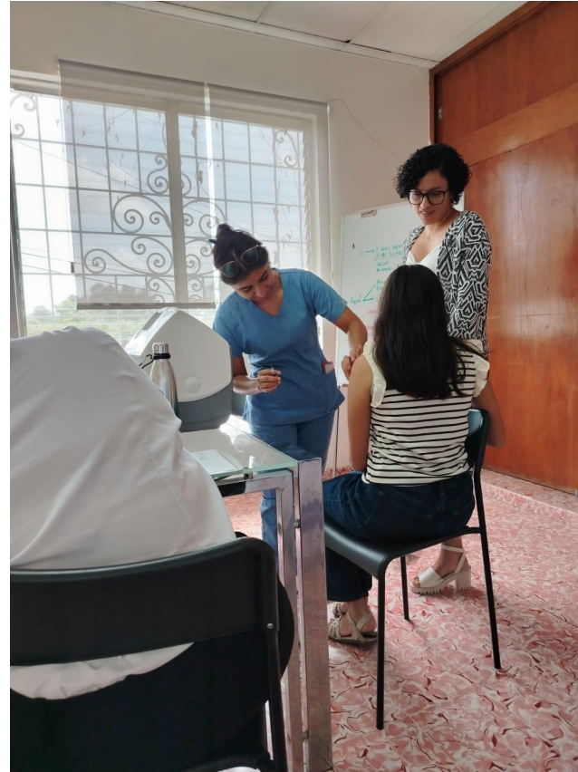
Jornada de vacunación contra influenza